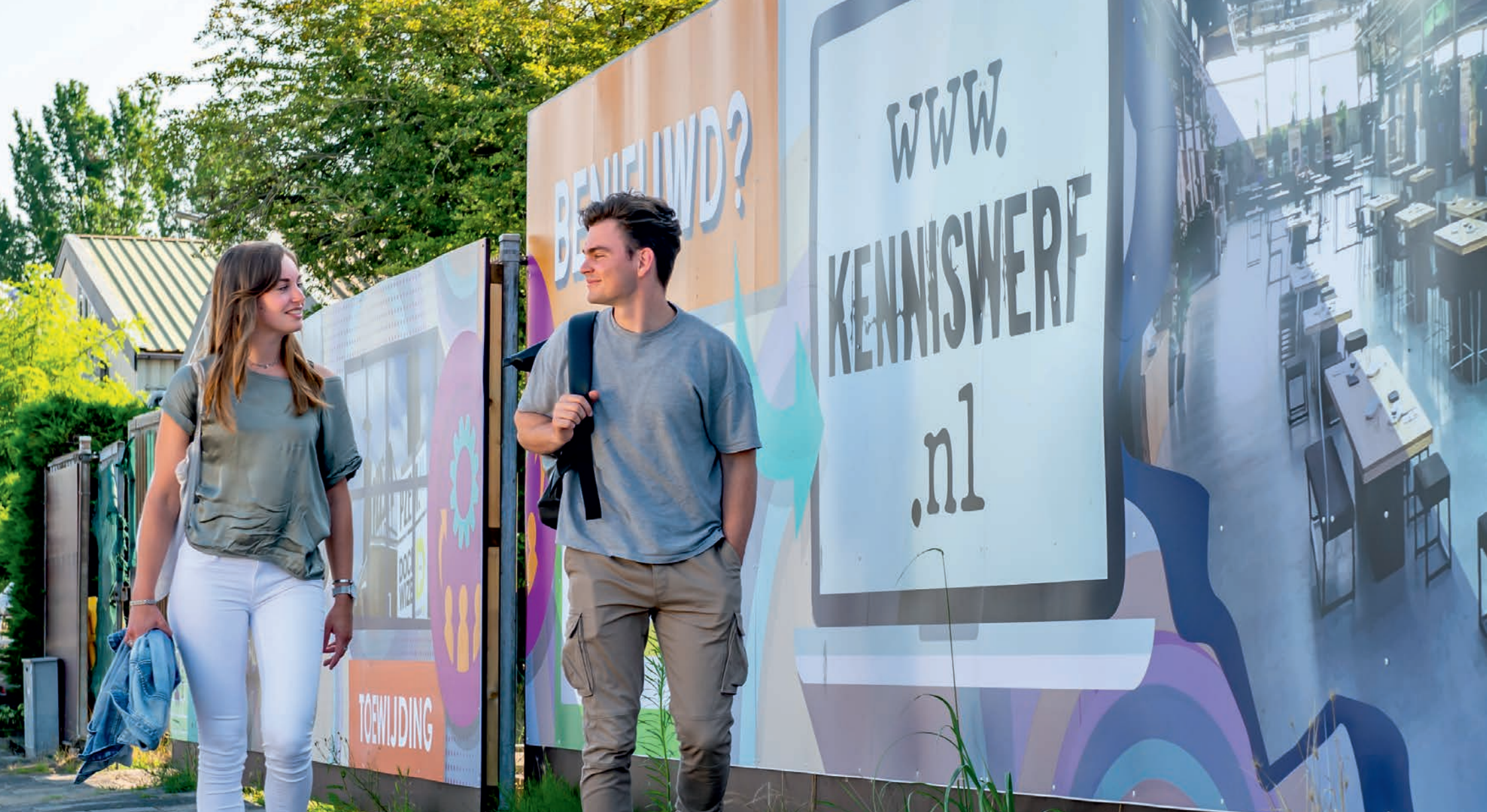
FICHE D: Fysieke ontwikkeling Kenniswerf Vlissingen