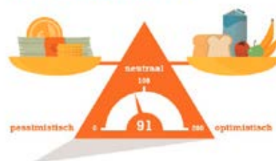
Financieel fit Barometer

► Lees meer over deze bijeenkomst op pagina 3